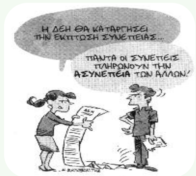
ΤΟΥ ΚΩΣΤΑ ΣΚΛΑΒΕΝΙΤΗ