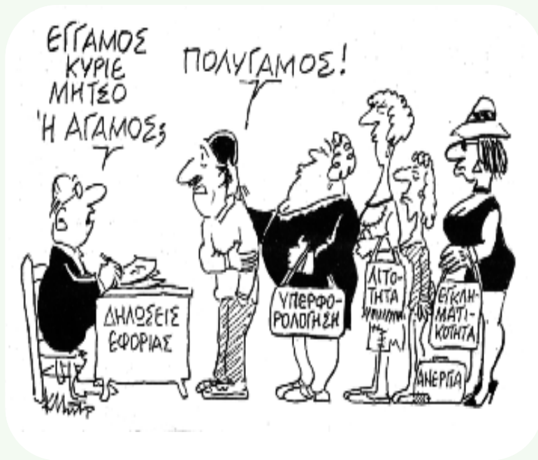
ΤΟΥ ΚΩΣΤΑ ΜΗΤΡΟΠΟΥΛΟΥ ΑΠΟ ΤΗΝ ΕΦΗΜΕΡΙΔΑ "ΤΑ ΝΕΑ"