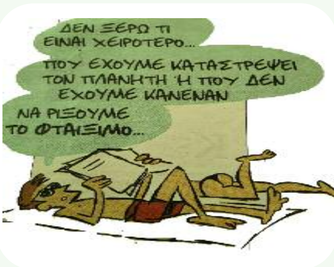
ΤΟΥ ΚΩΣΤΑ ΜΗΤΡΟΠΟΥΛΟΥ ΑΠΟ ΤΗΝ ΕΦΗΜΕΡΙΔΑ "ΤΑ ΝΕΑ"