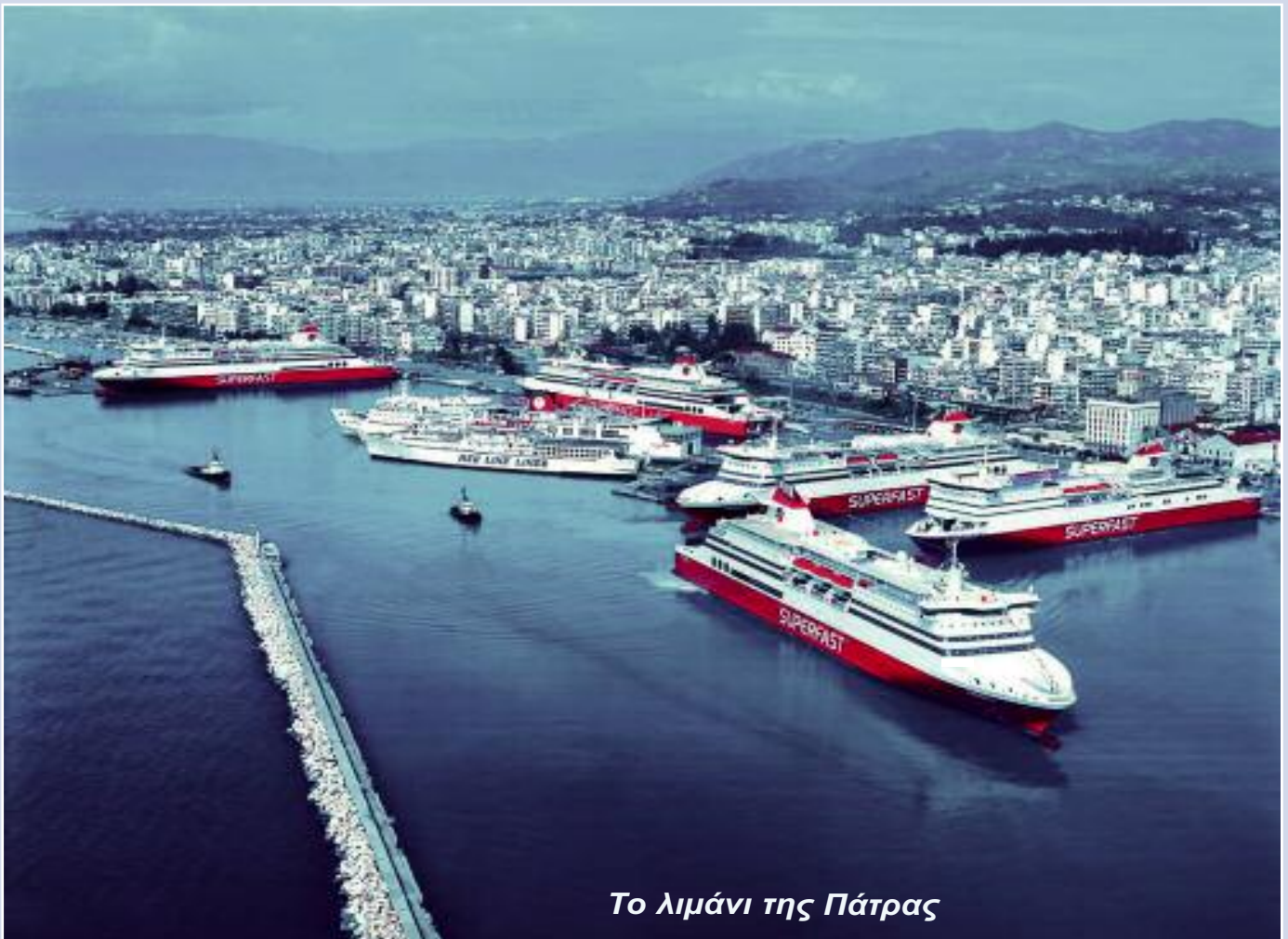
Το λιμάνι της Πάτρας

ΔΙΜΗΝΙΑΙΑ ΕΚΔΟΣΗ ΤΟΥ ΣΩΜΑΤΕΙΟΥ ΝΑΥΤΙΚΩΝ ΠΡΑΚΤΟΡΩΝ ΑΤΤΙΚΗΣ - ΠΕΙΡΑΙΩΣ ΕΤΟΣ 23ο • ΠΕΡΙΟΔΟΣ Γ' • ΦΥΛΟ 76 • ΙΟΥΛΙΟΣ - ΑΥΓΟΥΣΤΟΣ 2019