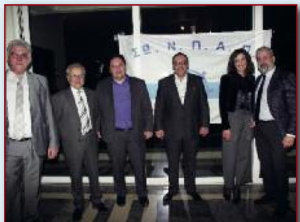
Το Δ.Σ. με το Γενικό Γραμματέα του ΥΕΝ κ. Χρήστο Λαμπρίδη.