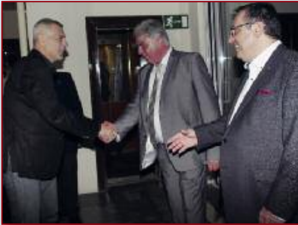
Ο Πρόεδρος κ. Φιριπής υποδέχεται το Δήμαρχο Πειραιά κ. Γιάννη Μώραλη.