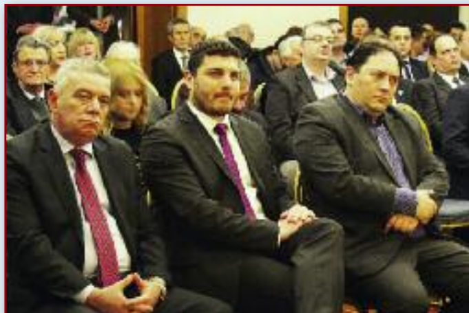
Ο Β Υπαρχηγός Αντιναύαρχος Λ.Σ. κ. Αθ. Ντούνης, οι Γ.Γ. ΥΕΝ κ. Δ. Τεμπονέρας και κ. Χ. Λαμπρίδης