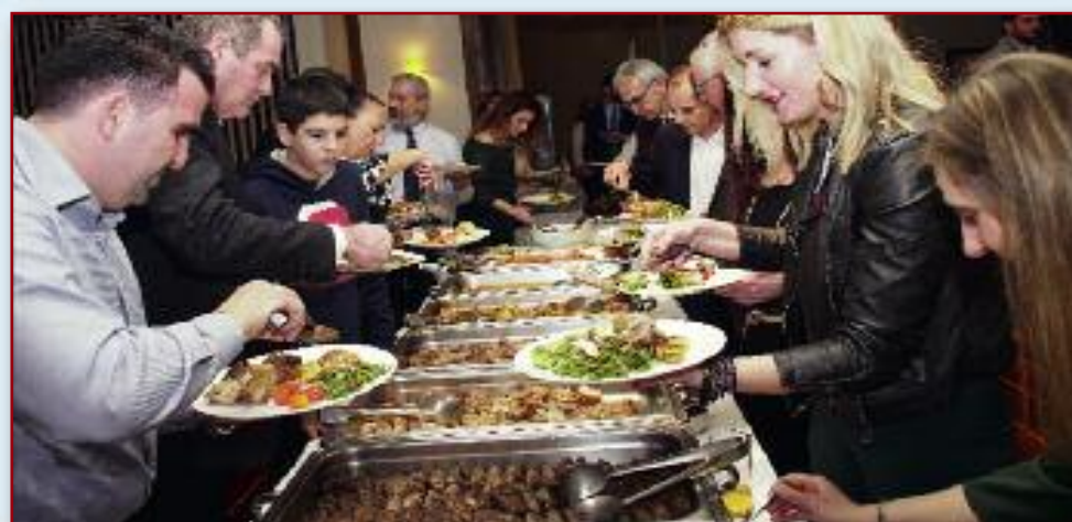
Γενική άποψη από τον πλούσιο μπουφέ της εκδήλωσης.