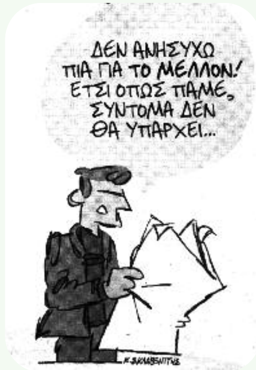
Του ΚΩΣΤΑ ΣΚΛΑΒΕΝΙΤΗ από "ΤΑ ΝΕΑ"