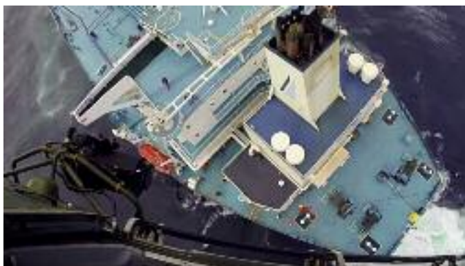
Φωτογραφία από το ελικόπτερο την ώρα της διάσωσης.

Συγκεκριμένα οι άνδρες της Πολεμικής Αεροπορίας ενημερώθηκαν το μεσημέρι του Σαββάτου για την ανάγκη άμεσης μεταφοράς σε νοσοκομείο του καπετάνιου του τάνκερ MINERVA GLORIA. Το τάνκερ, ελληνικής σημαίας, ξεκίνησε από το λιμάνι της Αιταγκράτια στην Βενεζουέλα στις 12 Φεβρουαρίου, με προορισμό το Ανόβερο της Γερμανίας.