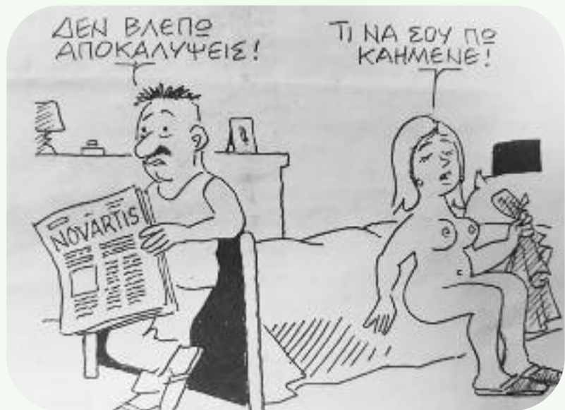
Του ΚΩΣΤΑ ΜΗΤΡΟΠΟΥΛΟΥ από "ΤΑ ΝΕΑ"

Κάθεται στο γραφείο, αρχίζει να δουλεύει και κάποια στιγμή διαπιστώνει ότι το φερμουάρ του είναι ανοιχτό. Χαμογελάει όταν θυμάται τι του είπε η γραμματέας του και αποφασίζει να την πειράξει λίγο. Την καλεί στο γραφείο του για να του φέρει ένα καφέ και την ρωτάει πονηρά: Όταν είδες την πόρτα του γκαράζ μου ανοιχτή, είδες και την jaguar μου; Η γραμματέας χαμογελώντας το ίδιο πονηρά του απαντάει αμέσως. Όχι κύριε προϊστάμενε το μόνο που είδα ήταν ένα mini cooper με δύο ξεφουσκωμένα λάστιχα.